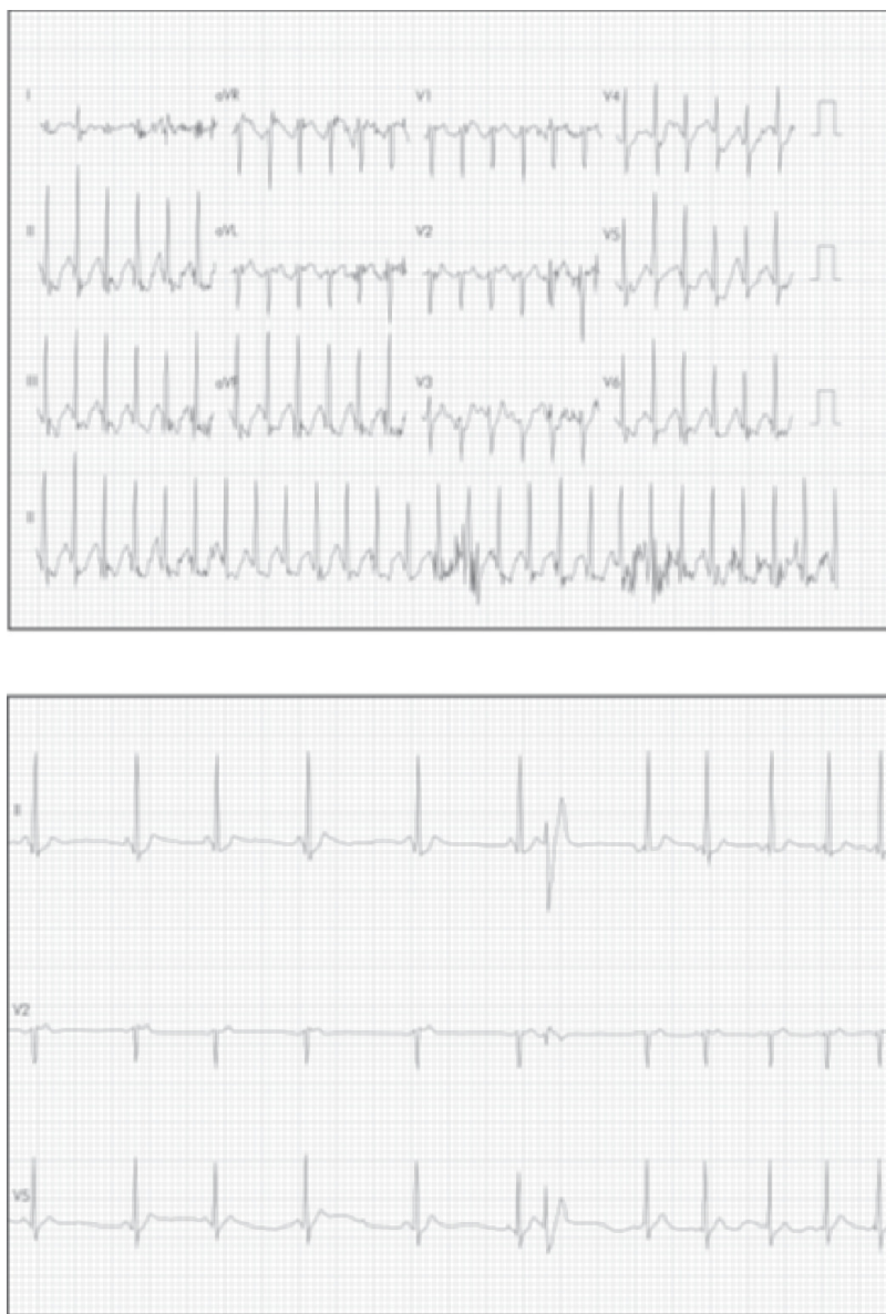
Figura 2 A. Electrocardiograma de recuperación inmediata (frecuencia cardíaca máxima 154). B. Un minuto post-ejercicio (frecuencia cardíaca 60).

El examen físico cardíaco de ingreso revela un corazón rítmico y sin soplos; pero, por recurrencia de los síntomas, se decide hospitalizarlo para estudio de síncope. El electrocardiograma muestra alteración de la repolarización anterolateral con elevación del punto J e hipertrofia septal y signos de sobrecarga ventricular izquierda; la troponina es negativa. Luego se llevó a coronariografía que mostró tronco izquierdo sin lesiones, arteria descendente anterior y circunfleja sin lesiones, arteria del ramus intermedio de pequeño calibre con placa proximal que ocluye el 50% del vaso y coronaria