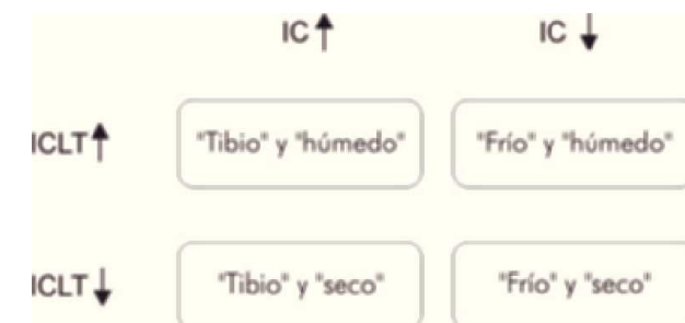
Figura 2. Esquema de Cuadrantes de Stevenson, en donde por medio de parámetros derivados de la cardiografía de impedancia se posiciona al paciente con falla cardíaca descompensada dentro de uno de cuatro "cuadrantes" fisiológicamente diferentes, con sus respectivos manejos farmacológicos. Recuérdese que los niveles séricos de BNP pueden ser combinados con los valores de ICLT para definir mejor el grado de sobrecarga hídrica del paciente. IC: índice cardíaco; ICLT: índice de contenido de líquido en tórax.