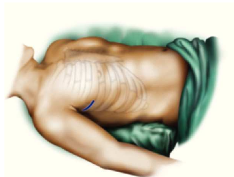
Figura 2 Durante la cirugía de la válvula mitral se hace una incisión de 5 cm en el cuarto o quinto espacio intercostal, lateral a la línea axilar anterior.