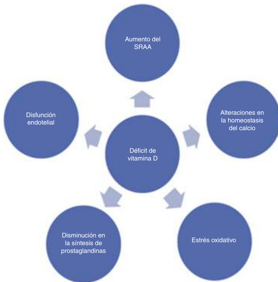
Figura 2 Mecanismos fisiopatológicos del aumento de la PA en pacientes con déficit de vitamina D. SRAA: sistema renina-angiotensina-aldosterona.

14 años de seguimiento a un grupo de pacientes. Los valores de la PA sistólica son 3,6 mmHg mayores en individuos con cifras de 25-hidroxicoalciferol < 16,6 ng/ml en comparación con los que presentan valores de 25-hidroxicoalciferol > 25,0 ng/ml 33 .