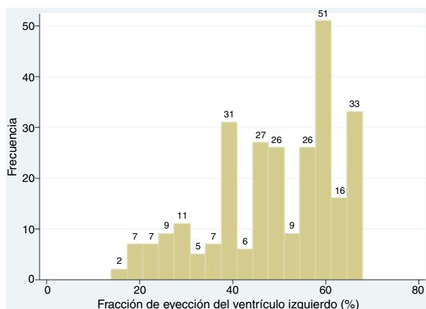
Figura 1 Histograma que muestra la distribución de la fracción de eyección del ventrículo izquierdo.

de pacientes tenían curva, tanto significativa como no significativa, en descenso; del subgrupo de pacientes que tenían el primer valor positivo, 32% hicieron delta superior a 20%; sin embargo, de esos, 37% tenían más de 6 horas desde el inicio de los síntomas por lo cual el primer resultado era diagnóstico. Si bien el diagnóstico de síndrome coronario agudo es eminentemente clínico, el 58,15% quedó registrado por presentar dolor torácico de características típicas y en 17% de los casos había causas alternas de elevación de troponina como en pacientes con crisis hipertensiva.