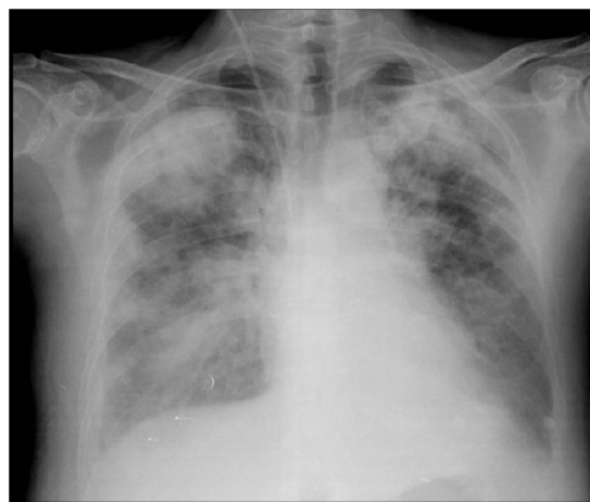
Figura 2 Empeoramiento radiológico con presencia de infiltrados alveolares bilaterales.

A las 72 horas, por tanto, salió a planta de Neurología para continuar cuidados y a las tres horas de estar en planta se encontró taquipneico, con tiraje y trabajo respiratorio y desaturación brusca, tos y expectoración vercosa. Se observó llamativo empeoramiento radiológico (fig. 2) y se trasladó de nuevo a la Unidad de Cuidados Intensivos por necesidad de intubación orotraqueal.