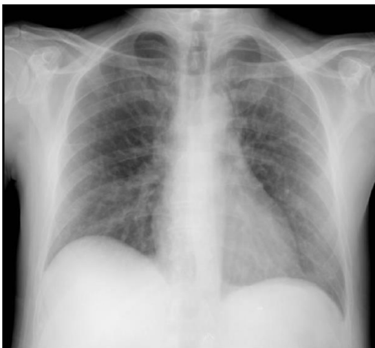
Figura 1 Radiografía de tórax. Ausencia de infiltrados patológicos. No hay signos de congestión.

que se recogieron fueron negativos al haber sido obtenidos bajo tratamiento antibiótico desde el inicio.